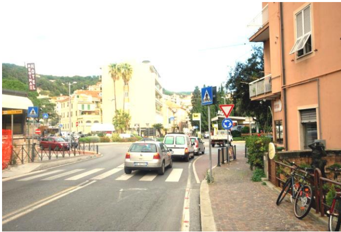
Punto 3 – Superare la rotonda

Arrivando con l'autostrada A10 (Genova-Ventimiglia), prendere l'uscita di Finale Ligure. Passato il casello, si procede per 800 metri fino ad immettersi sulla statale per Calizzano ( punto 1 ): qui girare a sinistra, in discesa (indicazione per Finale Ligure). Proseguire in discesa per 2,8 km, fino a raggiungere la via Aurelia, che in questo punto è quasi sul mare. Qui svoltare a sinistra sulla via Aurelia, seguendo l'indicazione per Finale Ligure ( punto 2 ).