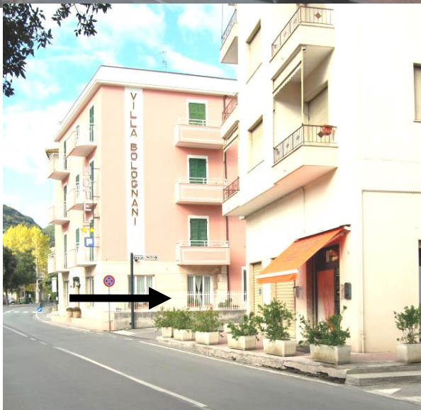
Punto 6 – Svolta a destra in via Bolognani

Costeggiare infine il torrente Sciusa per 300 metri, fino a trovare sulla propria destra la via Bolognani, in cui si dovrà svoltare ( punto 6 ).