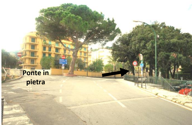
Punto 5 – Svolta a destra sulla via Calvisio

Procedere per 300 metri fino a raggiungere la chiesa di Finalpia (che ci si lascia sulla destra) e il torrente Sciusa, che qui è attraversato da un ponte in pietra percorribile solo in senso opposto.