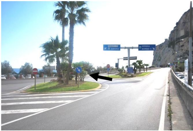
Punto 2 – Svolta a sinistra sulla via Aurelia

Arrivando con l'autostrada A10 (Genova-Ventimiglia), prendere l'uscita di Finale Ligure. Passato il casello, si procede per 800 metri fino ad immettersi sulla statale per Calizzano ( punto 1 ): qui girare a sinistra, in discesa (indicazione per Finale Ligure). Proseguire in discesa per 2,8 km, fino a raggiungere la via Aurelia, che in questo punto è quasi sul mare. Qui svoltare a sinistra sulla via Aurelia, seguendo l'indicazione per Finale Ligure ( punto 2 ).