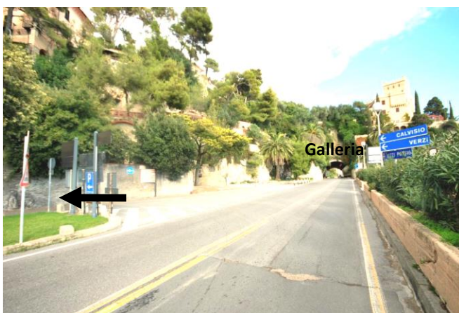
Punto 4 – Svolta a sinistra prima della galleria

Procedere per 400 metri, fino ad arrivare alla rotonda (piazza Vittorio Veneto; la stazione è sulla sinistra). Superare la rotonda, proseguendo sulla via Aurelia, lasciando il benzinaiolo alla propria destra ( punto 3 ).